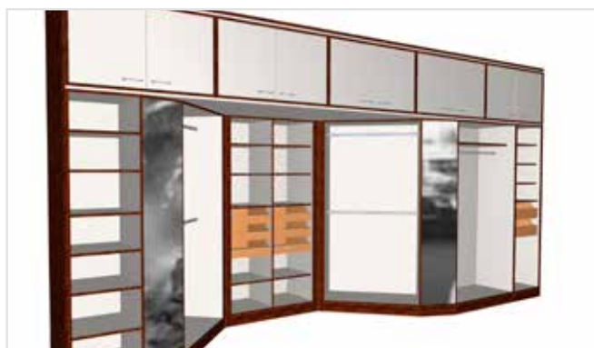
Progettazione di mobili con materiale definito