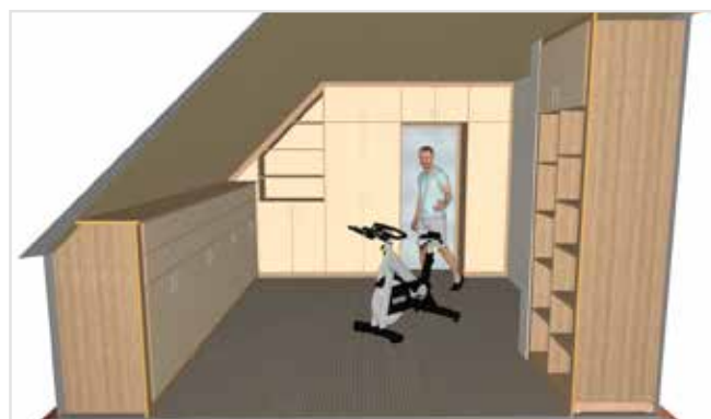
Grazie a SmartWOP la costruzione di tutte le strutture d'arredamento per le stanze è più facile che mai