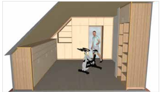
Die Konstruktion gesamter Einrichtungen für Ihre Räume mit SmartWOP leicht gemacht