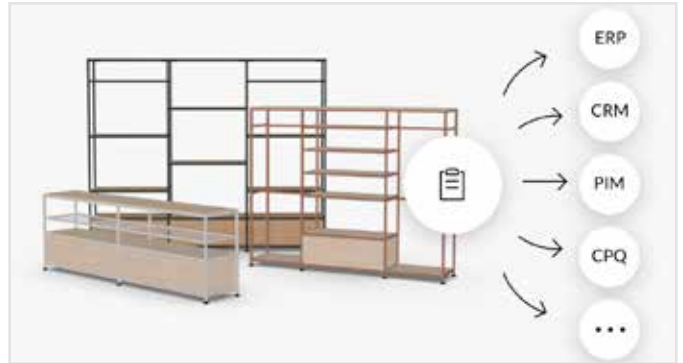
Integre el configurador sin dificultades en sus canales de distribución para disfrutar de un flujo de trabajo eficiente y comunicarse con sus clientes de forma óptima.