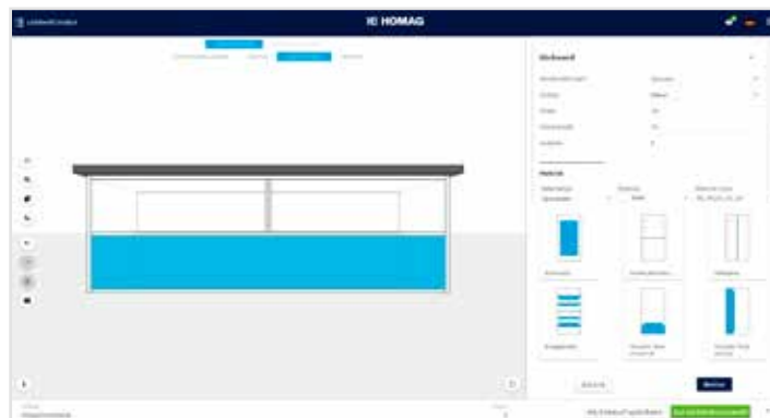
Selezionare il materiale e determinare l'ulteriore dotazione del mobile (parete posteriore, ripiano, divisore...)