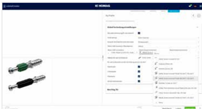
Definire la selezione della ferramenta dal catalogo memorizzato dei produttori più comuni.