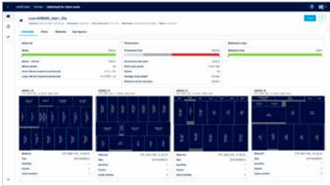
Datos de producción detallados