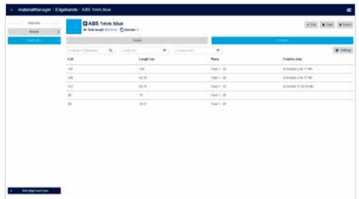
Restlængde og lagerplads for hvert enkelt kantbånd: Også her bevarer du overblikket.