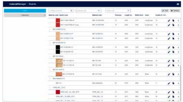
... og pladematerialer.