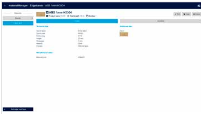
I den detaljerede oversigt ser du alle oplysninger på én gang.