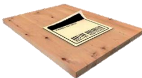
Die richtigen Informationen am richtigen Ort