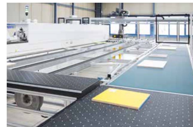
EDGETEQ S-500 y LOOPTEQ O-600

La máquina encoladora de cantos EDGETEQ S-500 es especialmente flexible en combinación con la unidad de retorno LOOPTEQ O-600.