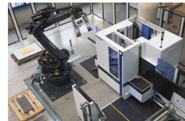
DRILLTEQ V-500 y FEEDBOT

El robot FEEDBOT con 6 ejes efectúa el tratamiento automatizado de las piezas en el centro de mecanizado vertical DRILLTEQ V-500.