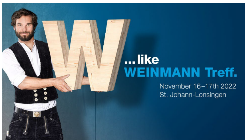
Imagen 1: W de WEINMANN Treff: el punto de encuentro del sector de la construcción en madera.

En la feria WEINMANN Treff, se presentan estos conceptos de instalación y se ofrece la posibilidad de celebrar sesiones de asesoramiento individuales. Además, se realizan demostraciones en directo de las máquinas.