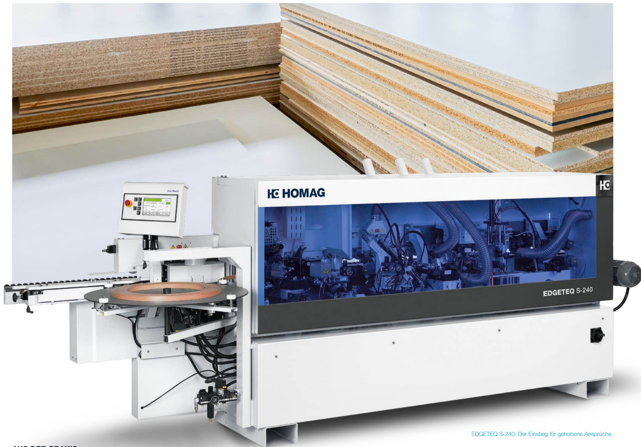
EDGETEQ S-240: Der Einstieg für gehobene Ansprüche.