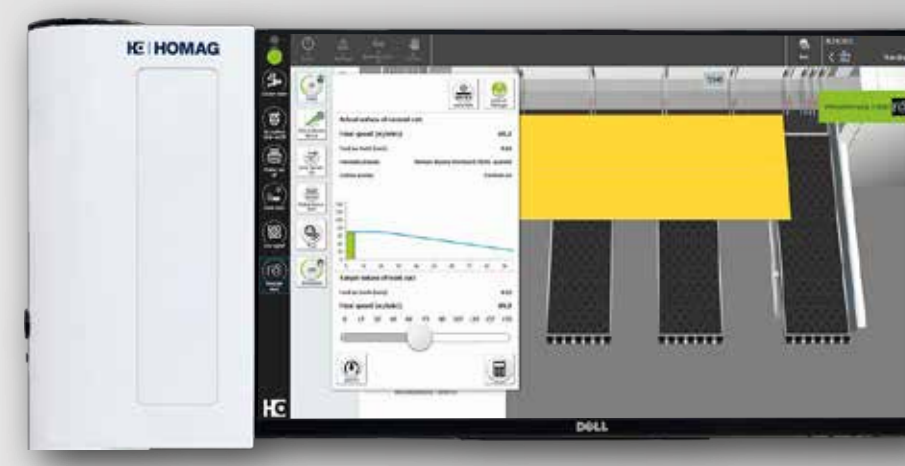
CADmatic Steuerungssoftware auf Ihrer Säge