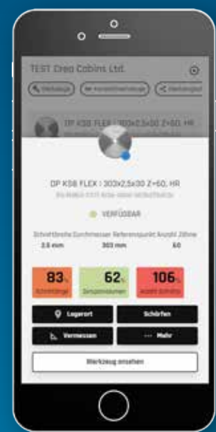
twinio Werkzeuge digital verwalten