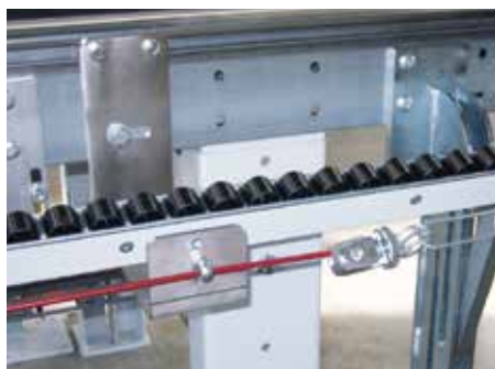
Rail à roulettes abaissable (option)