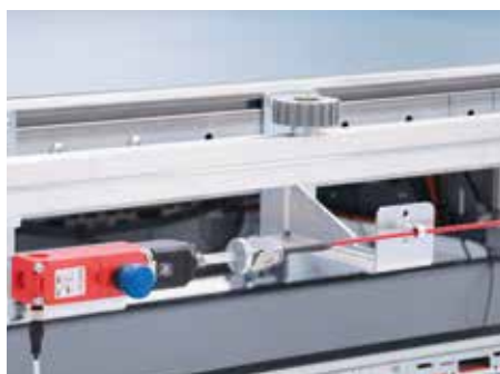
Équipement pour conformité CE : câble le long de la bande retour