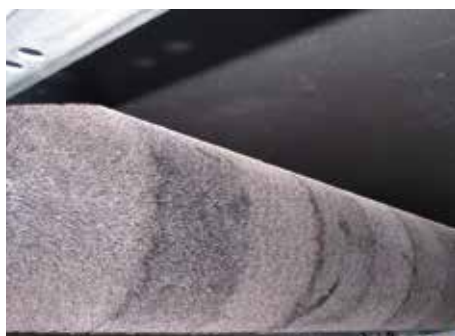
Nettoyage de bande