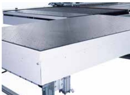
Table à coussin d'air pour la sortie (option)