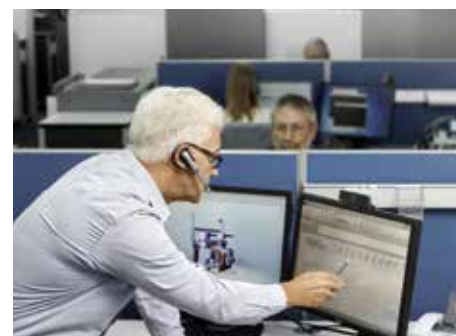
Service à distance : disponibilité élevée des machines et coût de production réduit grâce à la réduction des temps d'arrêt.